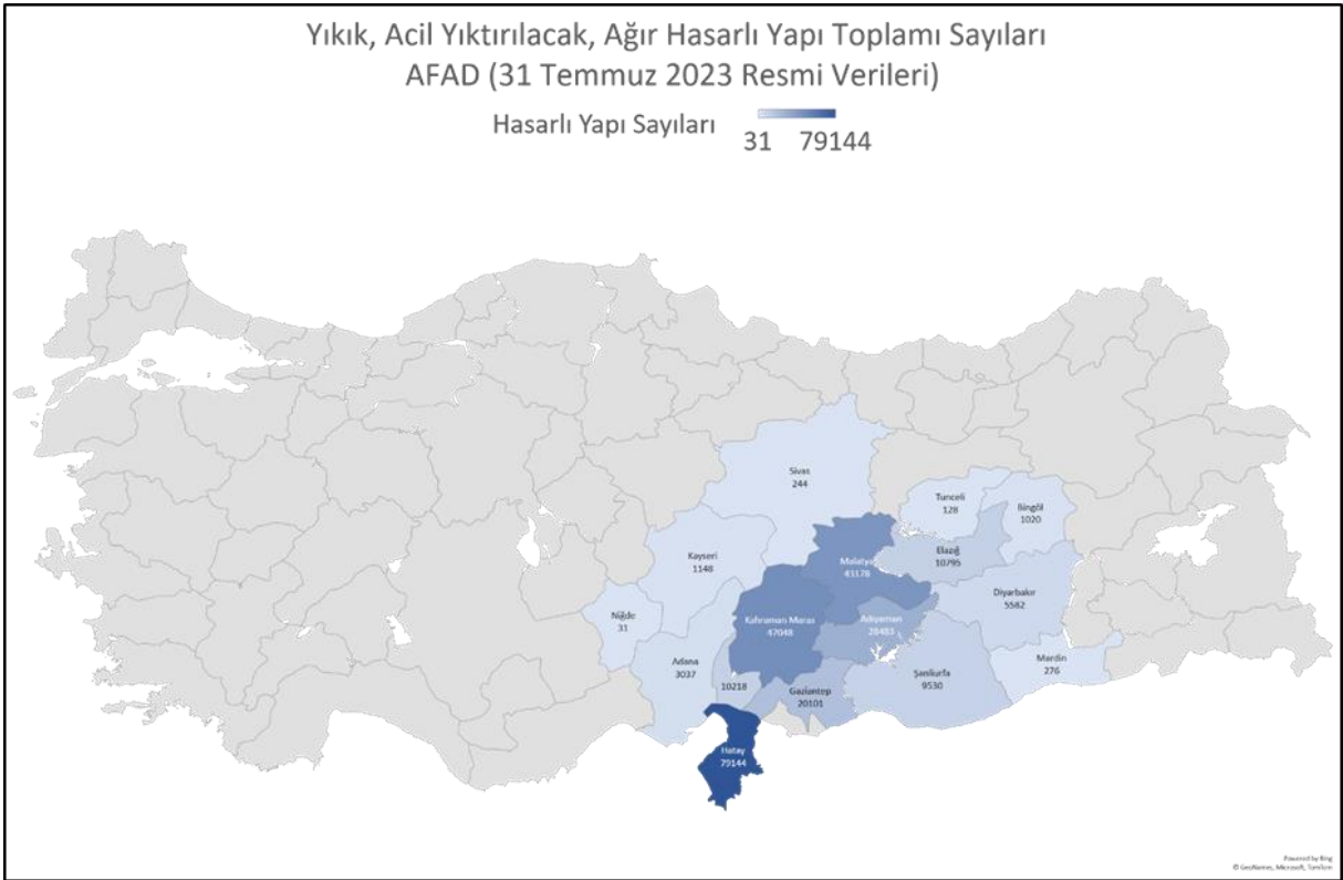
Şekil 2: Depremden etkilenen illerdeki hasarlı yapı sayıları (Yıkık, Acil Yıkırlacak ve Ağır Hasarlı Yapı toplamı)